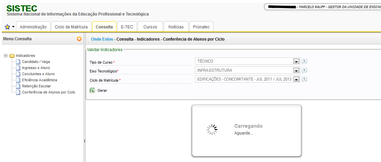
Figura 7 – Há ciclos que aparecem para serem selecionados, mas o sistema só fica “rodando” e não gera o relatório.